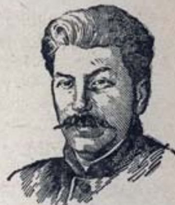
Генеральный секретарь ЦК ВКП (6) тов. СТАЛИН.