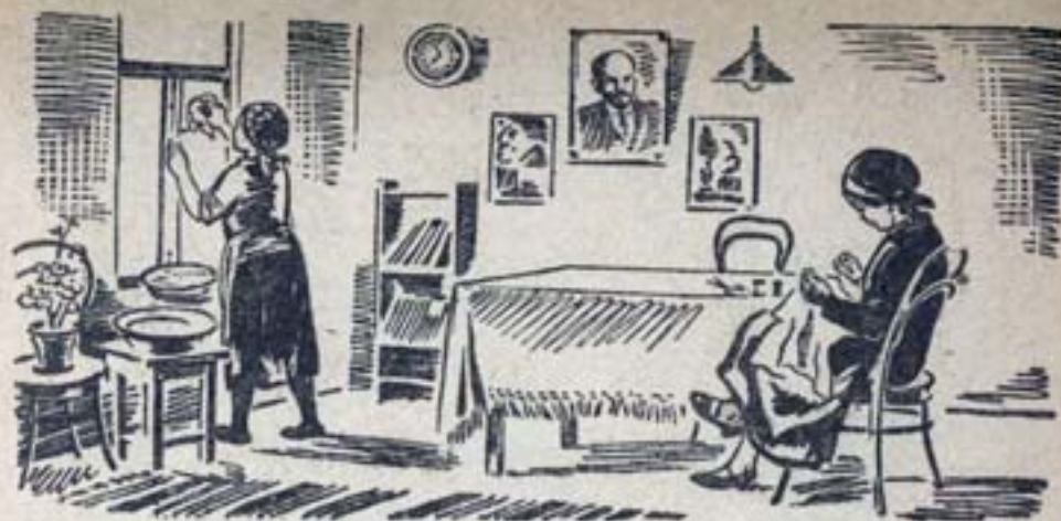
Даша дома. Маша дома.

Даша мыла. Мыла рамы. Даша мыла раму. Даша мыла 5 рам. Даша мыла 2 раза. Там 2 таза.