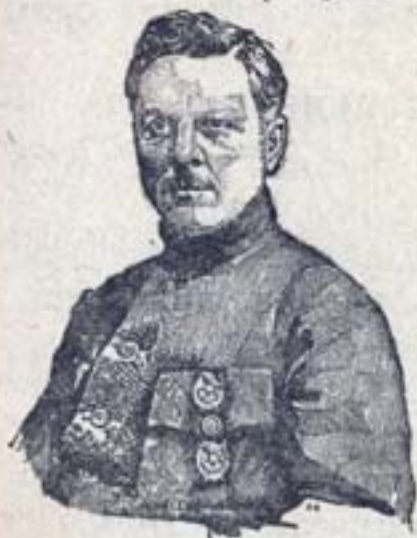
Народный комиссар по военным и морским делам тов. ВОРОШИЛОВ.

Готовиться к обороне по-настоящему — это значит прежде всего удесятить свою работу на заводах. Ведь драться будут не только на фронтах. Обороняться будет вся страна.