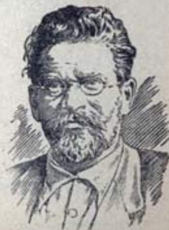
М. И. КАЛИНИН.

Михаил Иванович Калинин родился в 1875 году в деревне Верхняя Троица, Тверской губернии. Семья тов. Калинина была большая, жила бедно. С трудом поступил он в земскую школу. Учился хорошо. После этого он четыре года служил мальчиком у соседней помещицы.