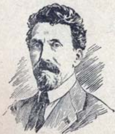
Председатель Совнаркома СССР тов. А. Н. РЫКОВ.

Все республики объединились в Союз советских социалистических республик (СССР).