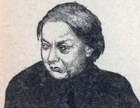
Н. К. КРУПСКАЯ

Рабочий класс является передовым отрядом всех трудящихся. За ним идут все массы трудящихся. И в этом его сила. Только как вождь всех трудящихся рабочий класс может победить.